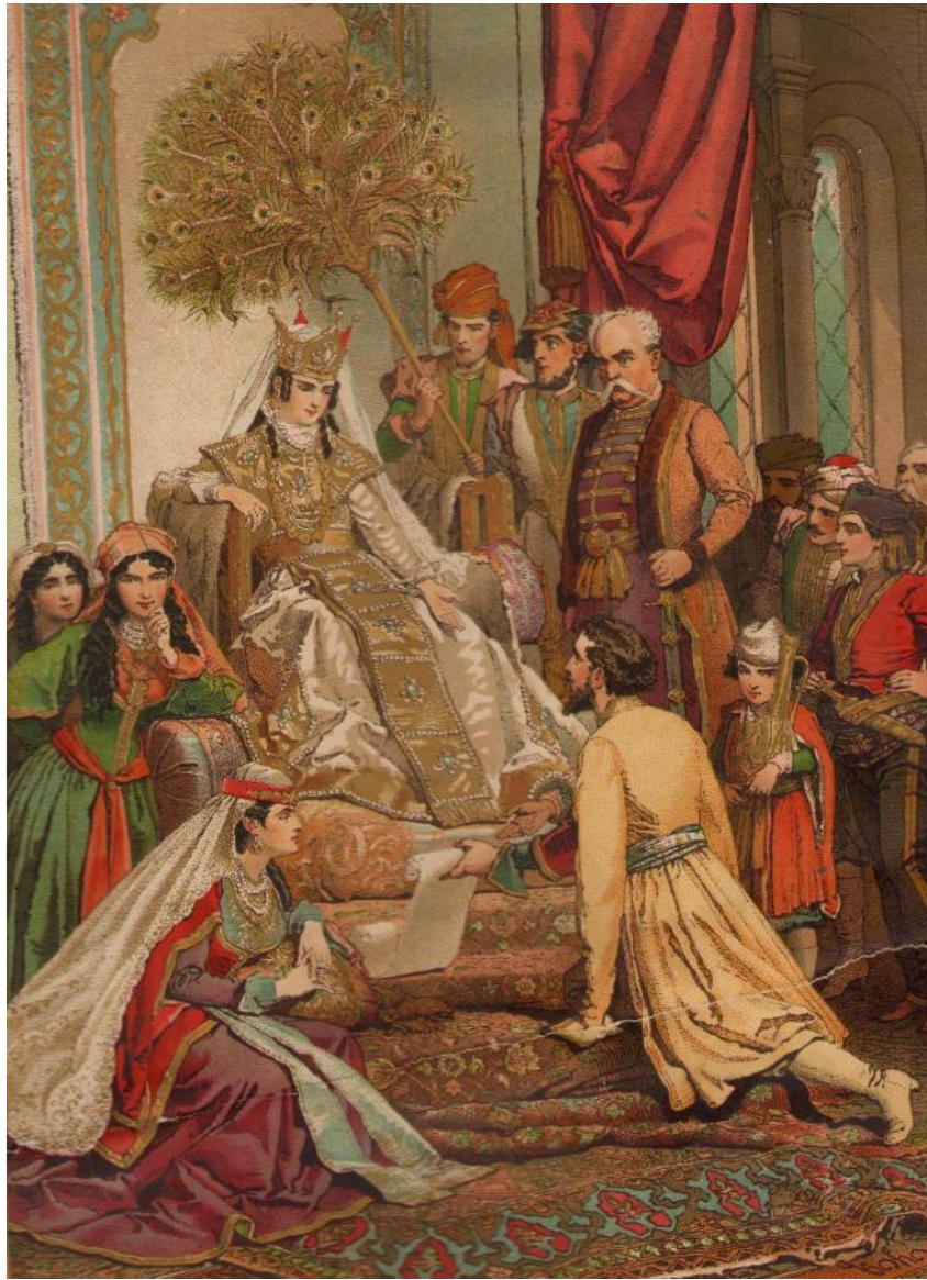
მიხაი ზიჩის ილუსტრაცია (1880-იანი წლები) – „ვეფხისტყაოსნის“ 1884 წლის გამოცემიდან